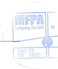
S. Bauer Bearbeiter